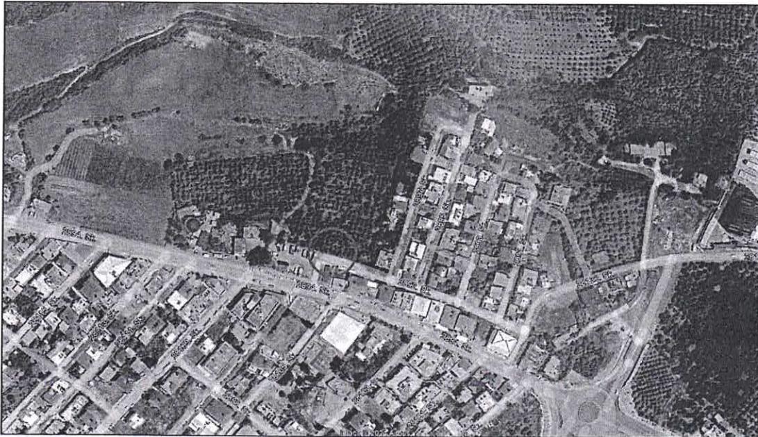
Harita 1: Plan Değişikliği Alanının Uydu Görüntüsü

Bahse konu plan değişikliği alanı Mersin İli Yenişehir İlçesi TKGM' de Kocavilayet Mahallesi sınırları içerisinde yer almaktadır. 1/1000 ölçekli hâlihazır haritalarda, O33A17D2C paftasında kalmaktadır.